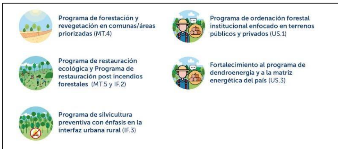
Figura 2. Medidas de acción de la Estrategia que se implementan en proyectos territoriales concursables.

Las actividades posibles de financiar en cada programa, junto a los costos asociados, se describen en detalle en las bases técnicas del concurso.